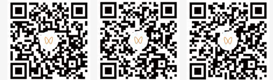
扫一扫，观看当天直播回顾